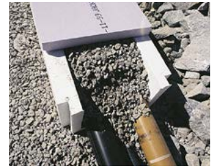
Isolerlåda skyddar mot frost och tjälskjutning.