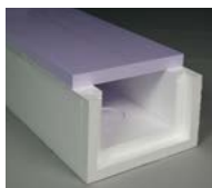
Jackopor® 150 isoleringslåda