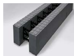
Thermomur® 350 Super