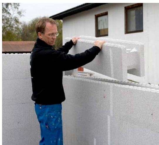
Jackon Thermomur® är enkel att hantera